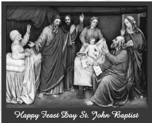
Happy Feast Day St. John Baptist