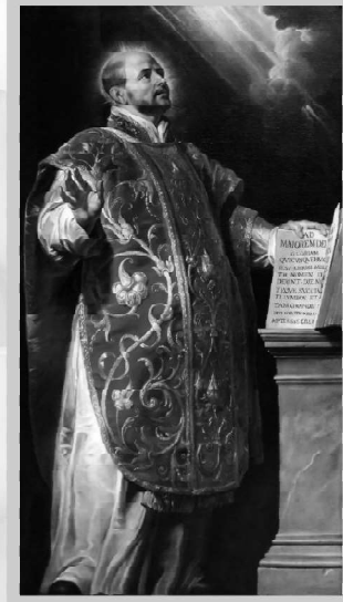
St. Ignatius 31st July