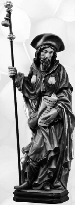
St. James 25th July