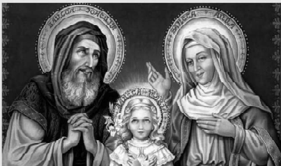
Ss. Anne & Joachim 26th July