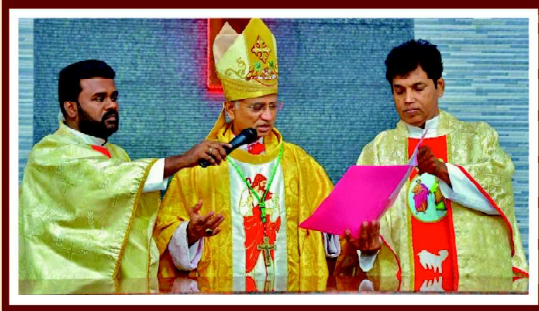
Church Blessing, Puthukiramam 02.03.2025