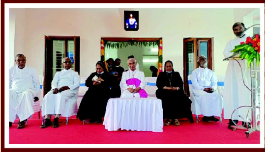
Convent and Hospital Blessing, Kamanayakkanpatti 01.03.2025