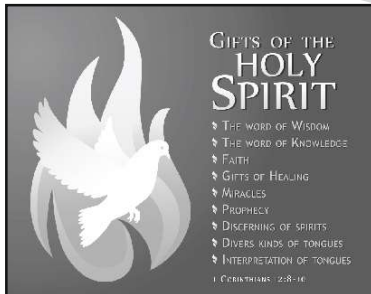
Descending of Holy spirit May 24