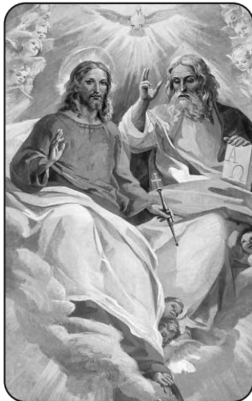
Trinity - May 31