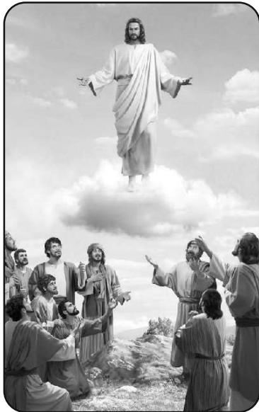
Assumption of our Lord May 17